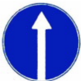
4.1.1 Движение прямо