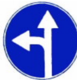
4.1.5 Движение прямо или налево