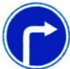
4.1.2 Движение направо