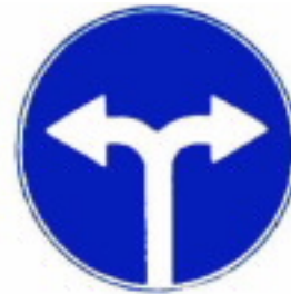
4.1.6 Движение направо или налево