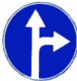
4.1.4 Движение прямо или направо