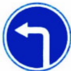
4.1.3 Движение налево