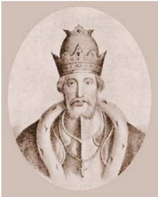
Князь Юрий III Данилович