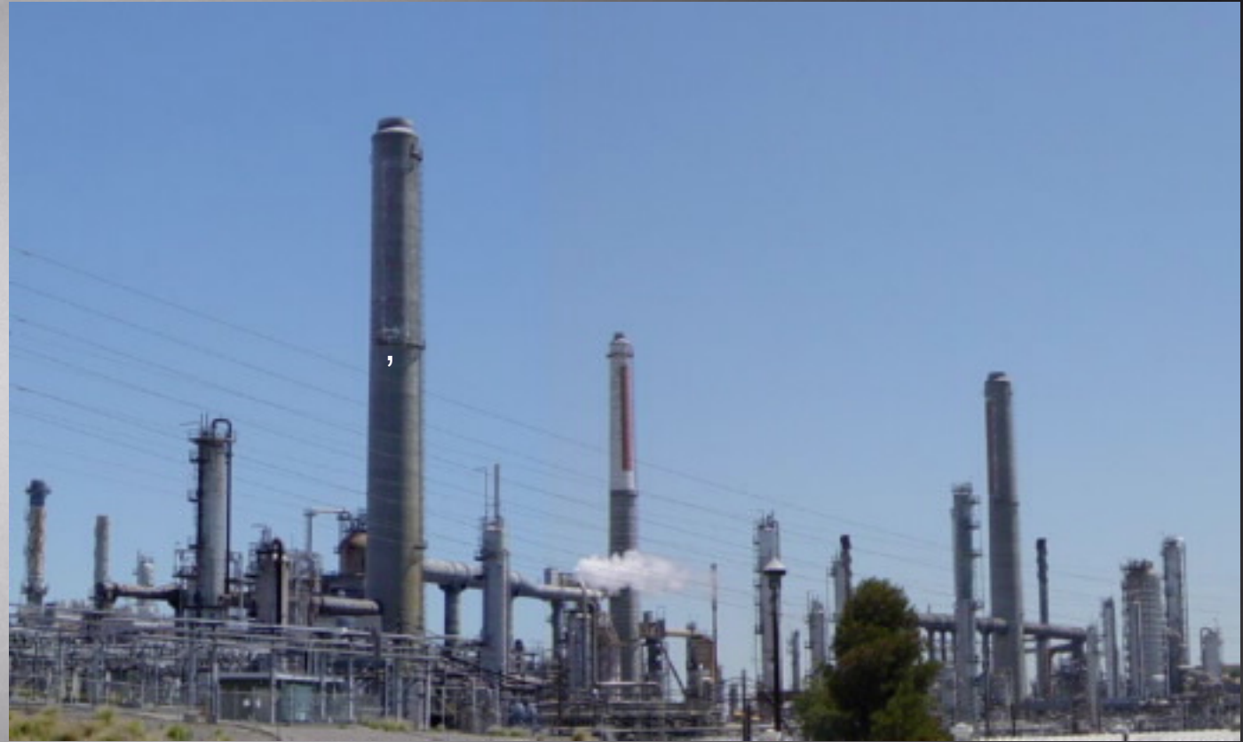
Нефтеперерабатывающий завод компании Shell в Калифорнии