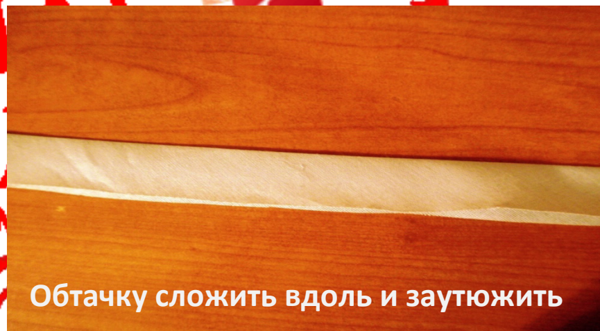
Обтачку сложить вдоль и заутюжить